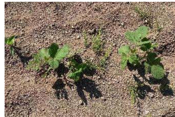
実際の圃場の大豆