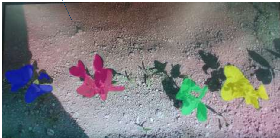
AI判定を行った画面