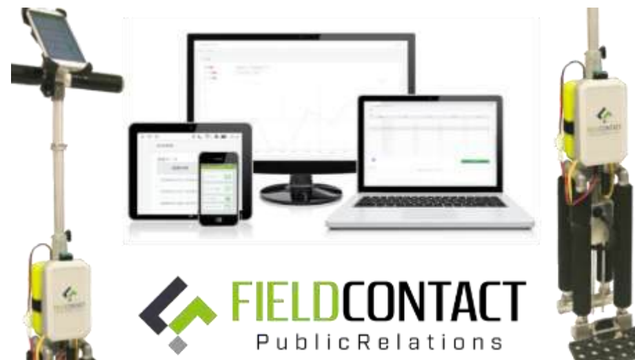
ゴルフ場向け 製品&WEBコンソール

「FIELD CONTACT」は、土壌の水分量・成分量・温度などをみえる化し、芝生などの生育や環境整備に役立てる為のクラウドシステムです。専用センサーボディを使って任意の土壌をセンシングし、クラウド上にデータを蓄積させることで、芝生の育成や管理をより高度化、効率化できます。