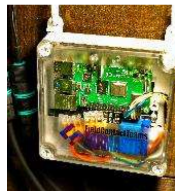
ドライブユニット