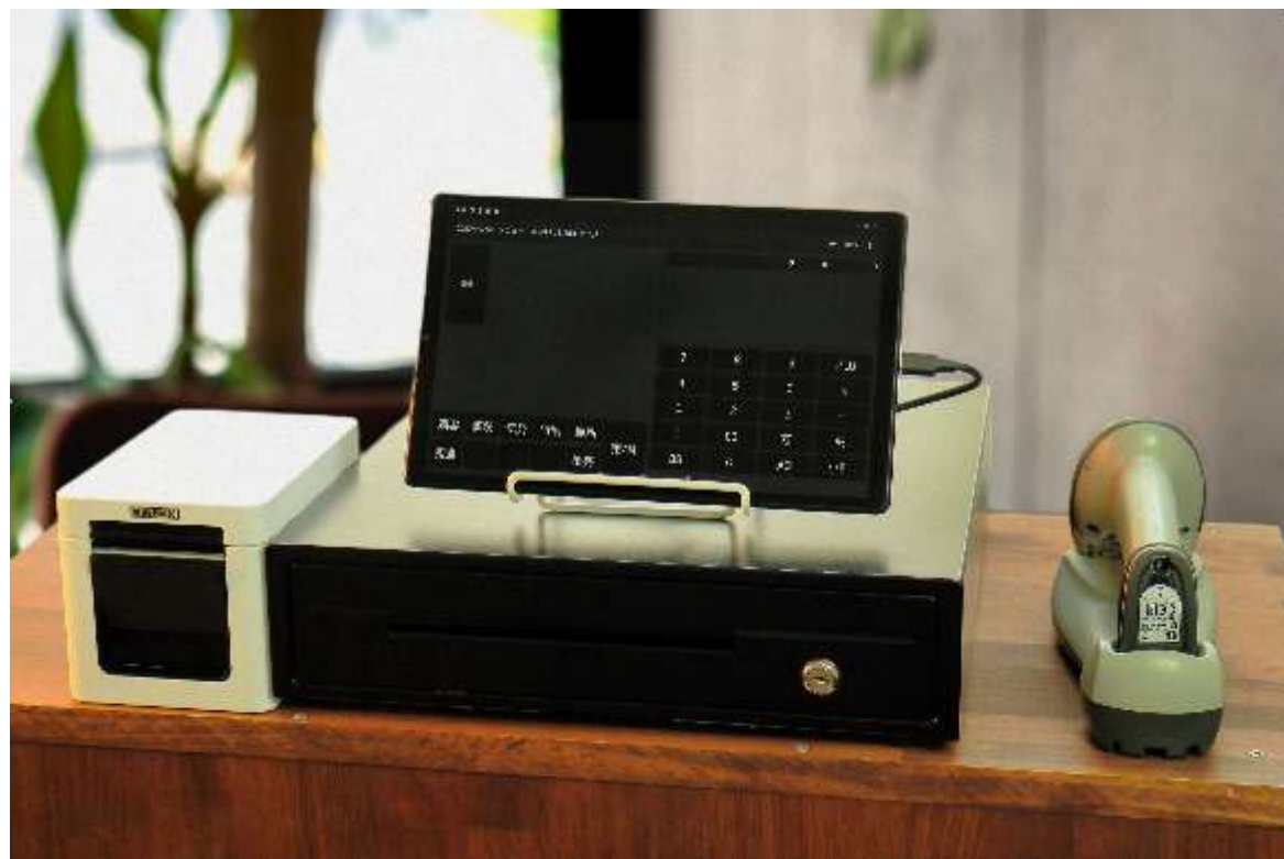
セットアップイメージ