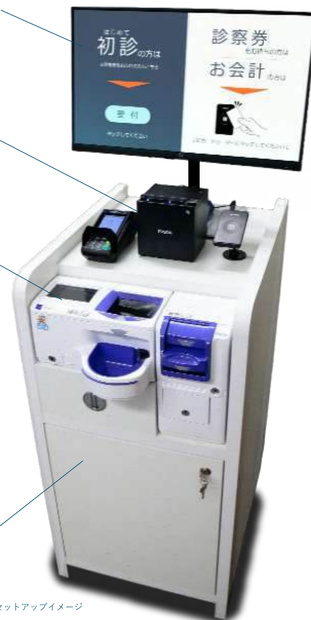
セットアップイメージ